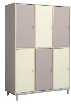
Fitt 40 6 persoane

ALEX MOBILIER METALIC ȘI DE UZ DIDACTIC SRL