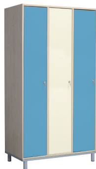
Fitt 30 3 persoane