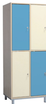
Fitt 30 4 persoane