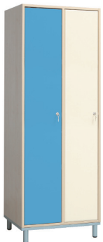
Fitt 30 2 persoane

Încuiabil! • uși pal melaminat sau pal cu protecție de plastic! • picioare metalice reglabile în înălțime!