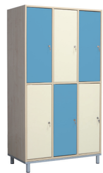
Fitt 30 6 persoane