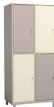
Fitt 40 4 persoane