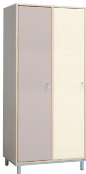
Fitt 40 2 persoane