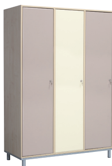
Fitt 40 3 persoane